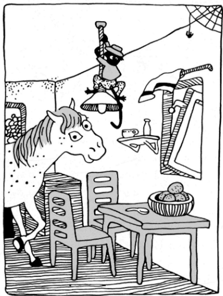
Așa arăta în Vila Villekulla.

Bine, treaba era că n-avea cine să-i spună să meargă să se culce seara. Dar Pippi găsisese ea o metodă bună – se trimitea singură la culcare! Uneori nu înainte de zece, fiindcă Pippi n-a fost niciodată de părere că un copil trebuie musai să se culce la ora șapte. Doar atunci se distra cel mai bine. Și de-asta străinul n-avea de ce să se mire că Pippi se plimba prin grădină după apusul soarelui, când se lăsase deja răcoarea nopții, iar Tommy și Annika dormeau tun de mult